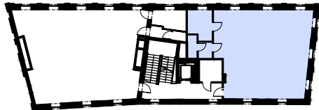
BUDYNEK NR 36 I PIĘTRO