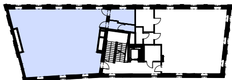
BUDYNEK NR 36 I PIĘTRO